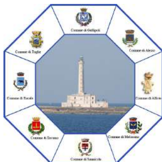
Ambito Sociale di Gallipoli